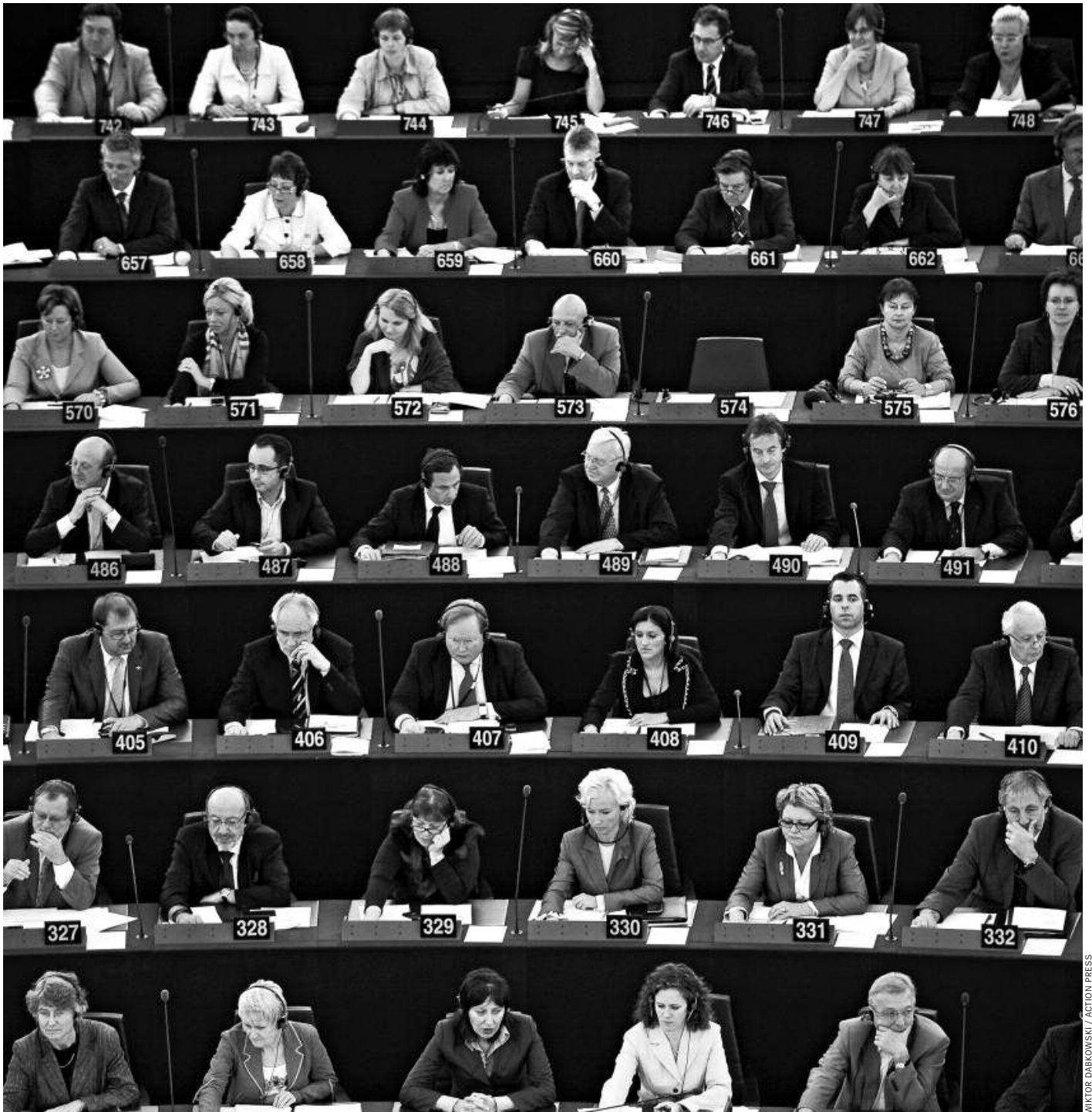
Abgeordnete im Europaparlament